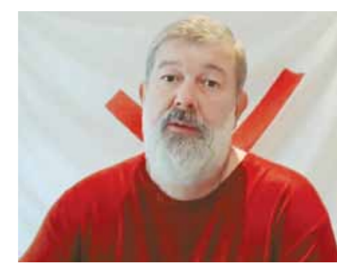
ФСБ РФ, контрразведчики во взаимодействии с полицией пресекли деятельность ячеек в Красноярске, Краснодаре, Казани, Самаре и Саратове.