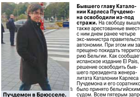
Пучдемон в Брюсселе.