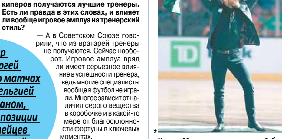
Конор Макгрегор, ирландский боец MMA, возмутитель спокойствия и просто горячий парень, объявил о своем уходе из спорта.

Памела Андерсон — единственная, кто поверил в уход Макгрегора из смешанных единоборств